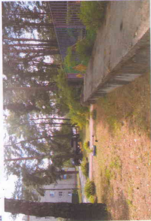
Подход к детскому саду со стороны ул. Бууровой