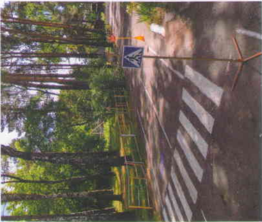
Вернуться на главную