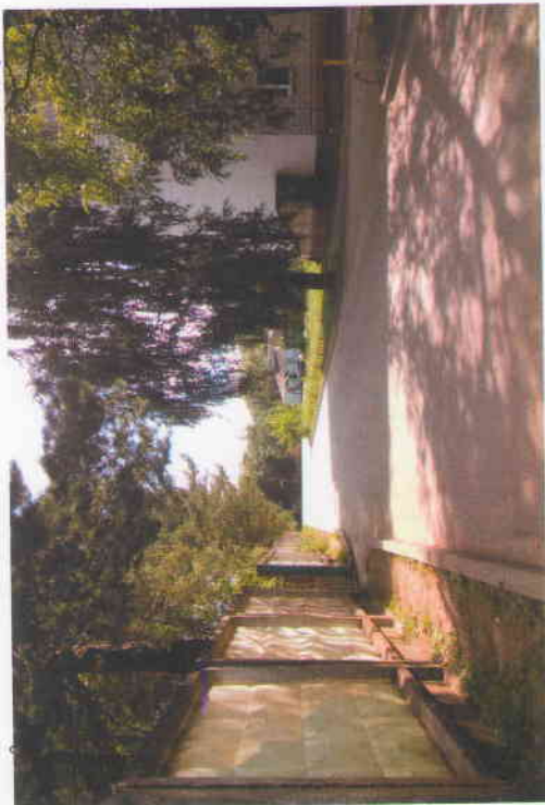
Фото подхода к образовательной организации